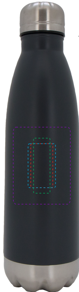
Ansicht 50 %