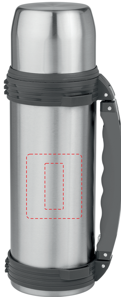
Ansicht ca. 40 %

Lassen Sie im Zweifel Probedrucke erstellen! Prüfen Sie dieses Freigabelayout bitte genau. Für Fehler übernehmen wir keine Haftung.